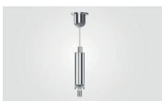
Suspension type «1» (x3)