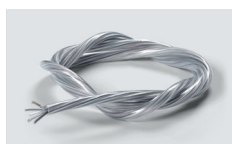
Câble d'alimentation 1,5 m de câble transparent 0,75 mm 2