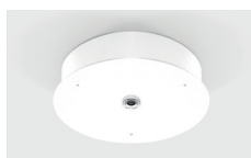
Patère de suspension centrale