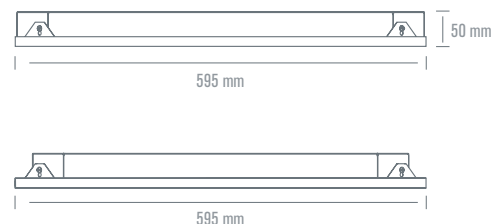
MODULE LED LINÉAIRE