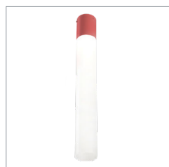
TUBE OPALIN AVEC MASQUE COULEUR