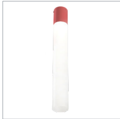
TUBE OPALIN AVEC MASQUE COULEUR